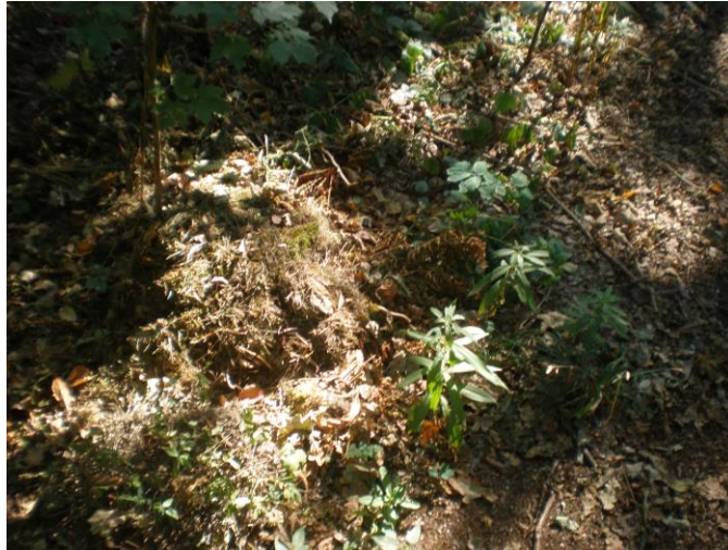
Äste von Büschen