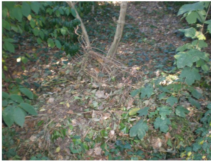
Äste und Blätter Kirschlorbeer